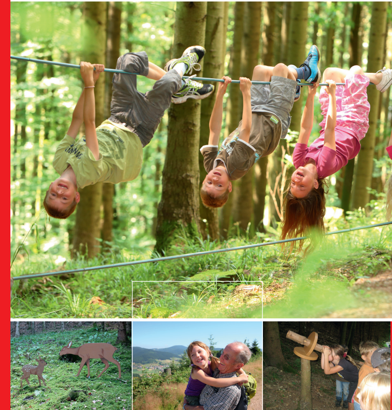
Haslach im Kinzigtal