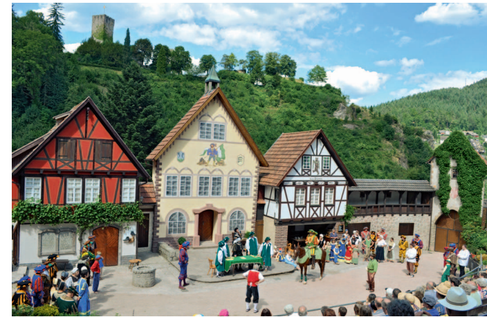
Die romantische Hornberger Freilichtbühne

Die 14 Stationen des Hornberger-Schießen-Weges An 14 Stationen erfahren Sie Interessantes und Schmunzelhaftes über das Ereignis im Jahre 1564, welches Hornberg weit über die Grenzen hinweg bekannt gemacht hat. Außerdem vermitteln Ihnen die Stationen Wissenswertes über die mehr als 900-jährige Geschichte der Stadt Hornberg.