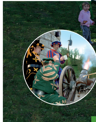
Szene aus dem Hornberger Schießen