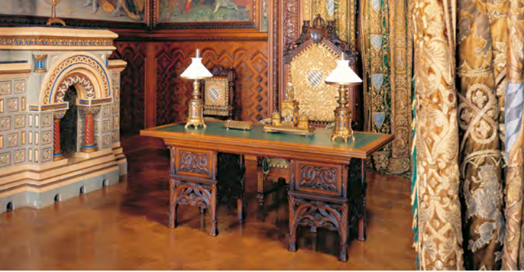
Arbeitszimmer mit Schreibtisch Ludwigs II.