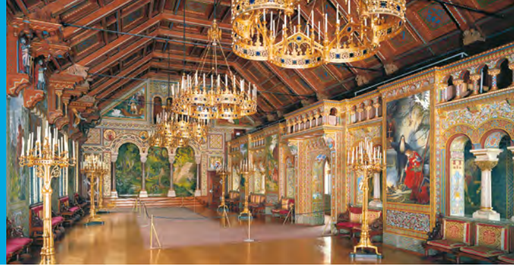
Der Sängersaal im vierten Geschoss des Palas

Bayerischer Staatsminister der Finanzen und für Heimat