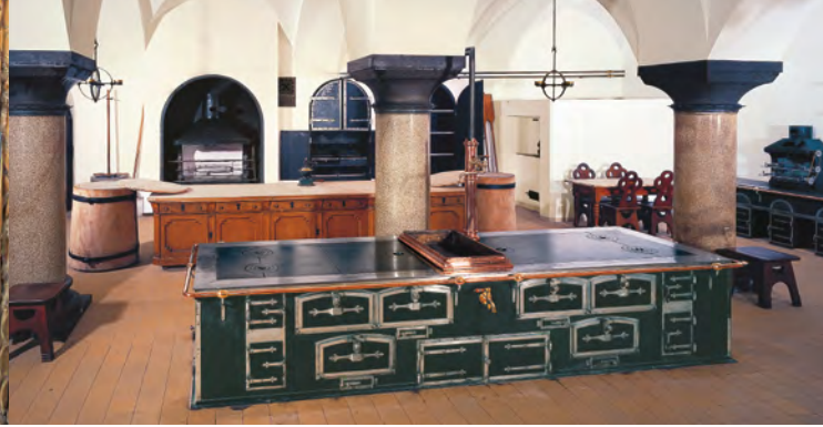
Schlossküche mit modernster Technik der damaligen Zeit