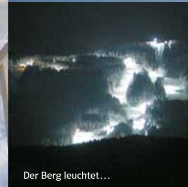
Der Berg leuchtet...